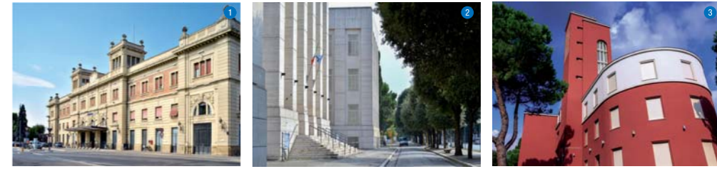
"Forlì Città del '900"

Il percorso "Forlì Città del '900" conduce il visitatore alla scoperta delle pregevoli testimonianze artistiche ed architettoniche legate ai primi anni del Novecento che dovevano segnare il volto della nuova "imago urbis", quasi una "piccola Roma", così come pensata dal governo fascista. L'itinerario interessa un'area compresa tra il cosiddetto "quartiere razionalista", che si snoda sull'asse Viale della Stazione - Piazzale della Vittoria, e la centrale Piazza Saffi.