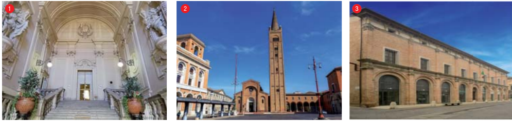
"Forlì Città d'Arte"

Il percorso "Forlì Città d'Arte" è dedicato alla scoperta del patrimonio storico-artistico e monumentale della Città.